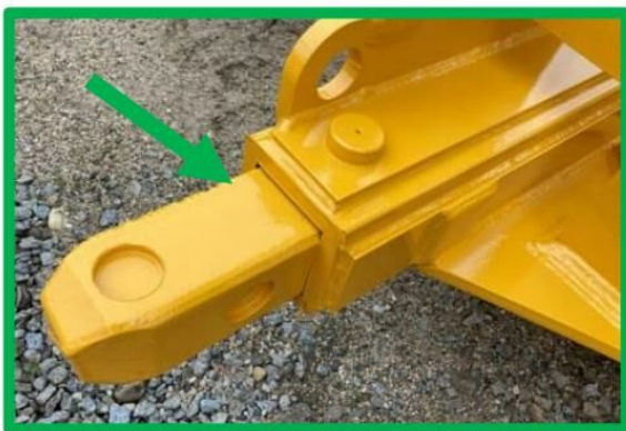
תמונה מס' 3 - התקן חיבור לא מרותך (4-pin fishplates)