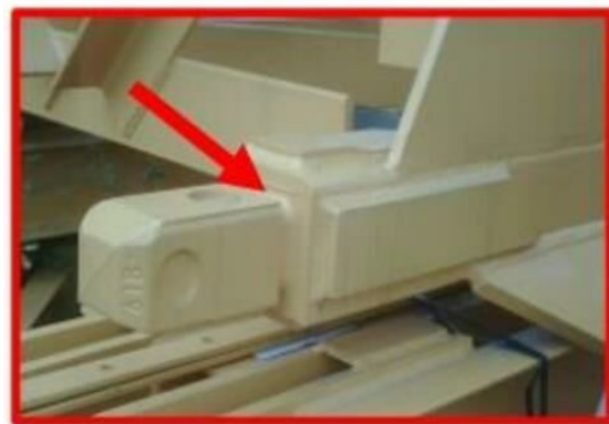
תמונה מס' 2 - התקן חיבור מרותך (welded fishplates)